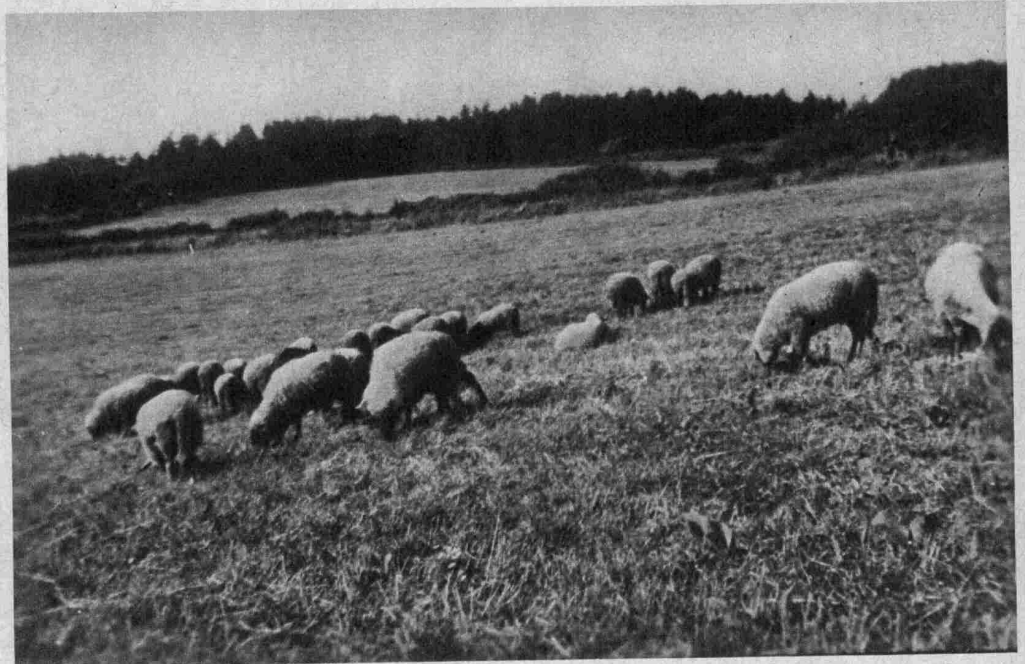
Bild 2. - Schafherde.

Eine hübsche Aufnahme. Aber waagerechte Linien dürfen das Bild nie hälften. Ein schöner Wolkenhimmel würde die Aufnahme noch günstiger gestalten.