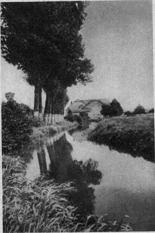
Bild 1. - Mühle im Röserbann.