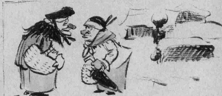
d'Strullches: Eischt Haus ass verbraunt bis op de Stomp, a mâr konnten net leschen, mâr hâte kü Wässer, d'Bäbbches: Net meng le'f, hätt dâr dât Wässer gehât wât dâr emmer bis elo an d'Melech gedoen huet, dann hätt dâr gut dermatt d'Feier gelüsch kreit.