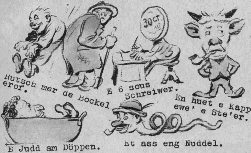
Hutsch mer de Bockel erof.