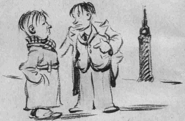
Den Isi: Hei ass e Kostüm de' gaunz sellten ass. De Misch: Den doen ,je, je Den Isi: Eso' e Kostüm ass sellten. De Misch: A watter Deiwel ass dann dât fer e Kostüm? Den Isi: Dâs e Kostüm de' boer bezuelt ginn ass.