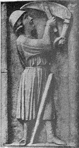
Paysan. (Cathédrale de Paris. Bas-relief du 13 e siècle.)

Sous Ermesinde, une vingtaine de localités luxembourgeoises furent affranchies : Beauraing (en 1209), Marville, Ivois (en 1213), Serchevaus-près-Laforêt (1215), Avioth (1223), Herbeuval (avant 1227), Cons-la-Grandville (en 1229), Meix-devant-Virton (avant 1234), Alle (en 1235), Echternach (1236), Breux (1238), Montmédy (1239), Thionville (1239), Chauvency-le-Château (1240), Proisy (1243), Stenay (1243),