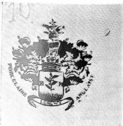
Assiette en porcelaine de la Faïencerie d'Huart, de Longwy, avec, au verso, les armes de la famille (agrandies). Coll. et photo Robert Matagne.