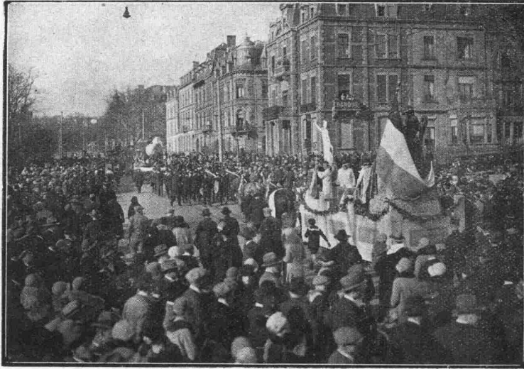
Cliché Publicitas, Luxembourg