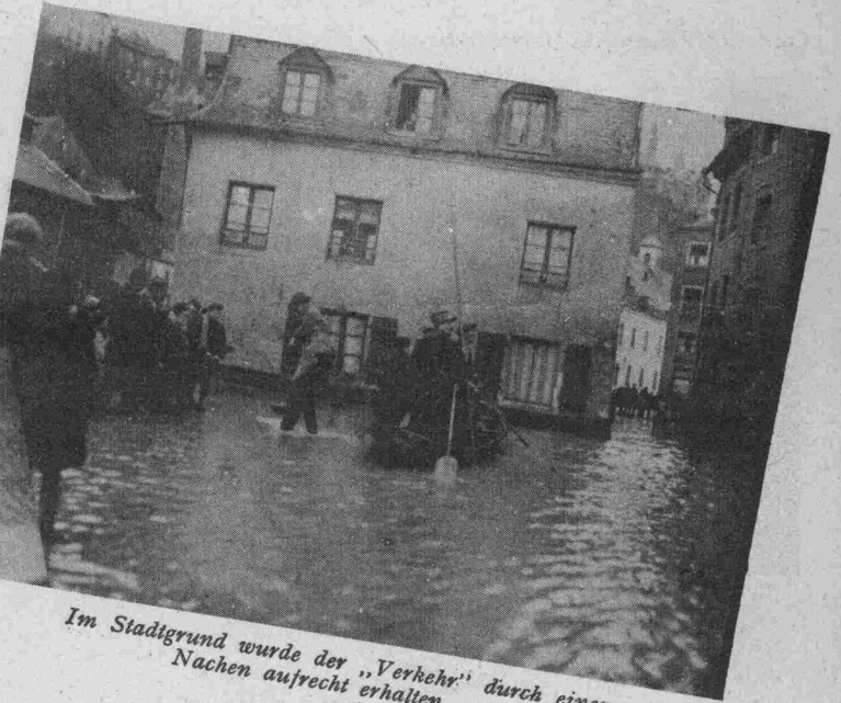
Im Stadtgrund wurde der „Verkehr“ durch einen Nachen aufrecht erhalten.