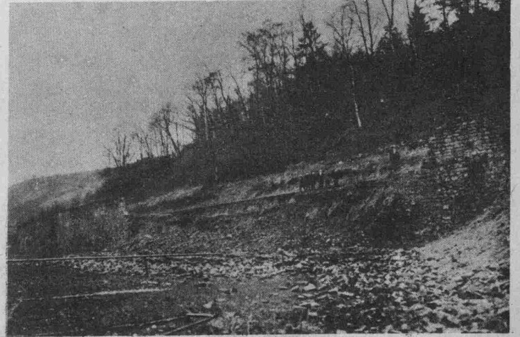
Im „Descherwé“ beim Sieckenhof stürzte die Stützmauer längst der Strasse auf mehrere Meter ein