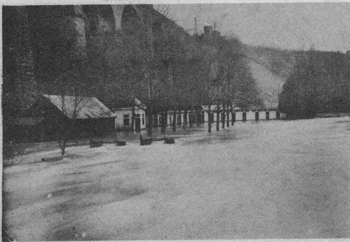
Die „Schwemm“ im Stadtgrund stand völlig unter Wasser; die Kabinen waren überschwemmt.