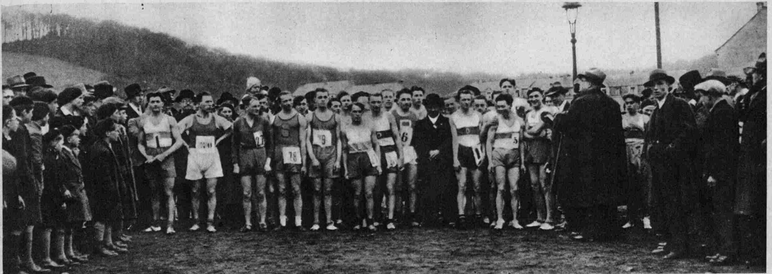
Crossmeisterschaft in Schifflingen (Der Start).