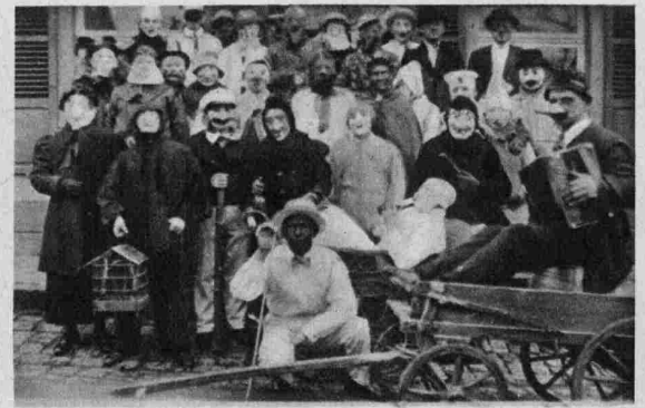
Wie man Carnaval in Befort feiert.

Né à Diekirch le 26. juin 1868. Décédé à Paris le 5 février 1934. Notaire à Feulen de 1897—1913. Notaire à Dudelange de 1915—1924. Notaire à Luxembourg de 1924—1934. Député Libéral de 1905—1911.