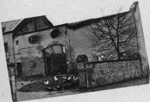
Brandruine Meiers vom 2 Februar.