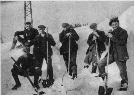
Burscheid im Schnee.