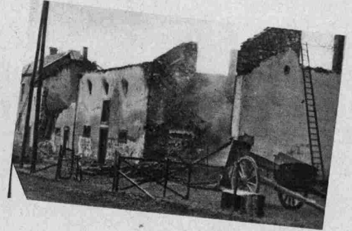
Brandruine Tasch-Melsen vom 20. Februar.