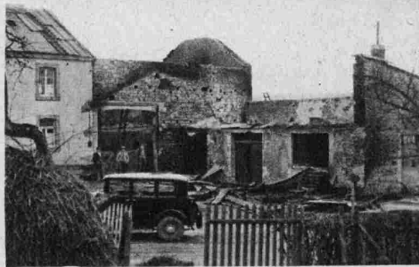
GROSSBRÄNDE IN CHRISTNACH. Brandruine Pütz vom 10. Februar.