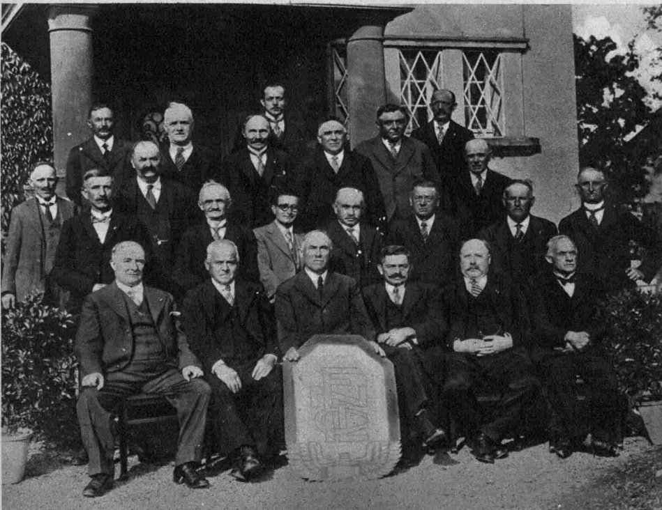
Pensionierten-Feier des Eisenbahner-Vereinigung Ulffingen am 7.7.35.

1. u. 2. Aus dem Umzug. 3. Der Präsident des Organisationskomitees spricht. 4. Verschiedene Musikanten wurden mit dem Verdienstkreuz des Adolfverbandes für 25-jährige Tätigkeit ausgezeichnet.