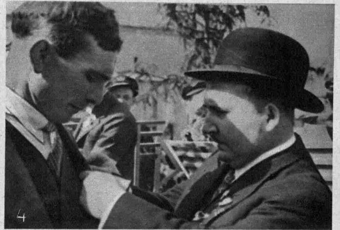
Stiftungsfest und Fahnenweihe der Fanfare von Canach. 7.7.35

1. u. 2. Aus dem Umzug. 3. Der Präsident des Organisationskomitees spricht. 4. Verschiedene Musikanten wurden mit dem Verdienstkreuz des Adolfverbandes für 25-jährige Tätigkeit ausgezeichnet.