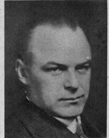
Sidney R. Kent