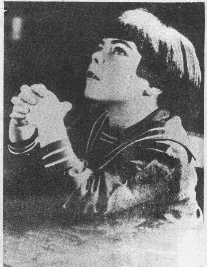
Zur bevorstehenden Hinrichtung von Sacco-Vanzetti. Das kleine Töchterchen bei seinem täglichen inbrünstigen Gebet, damit sein Vater begnadigt werde.