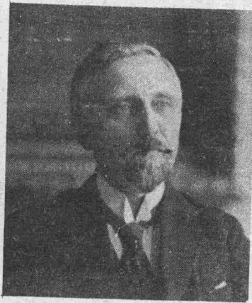
M. Reuter Ministre d'État, Photo Edouard Kütter..