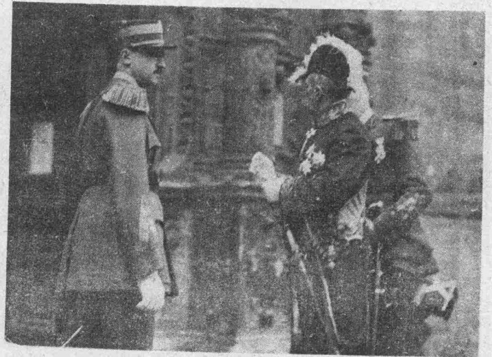
Le Prince Félix se rend au „Te Deum.”