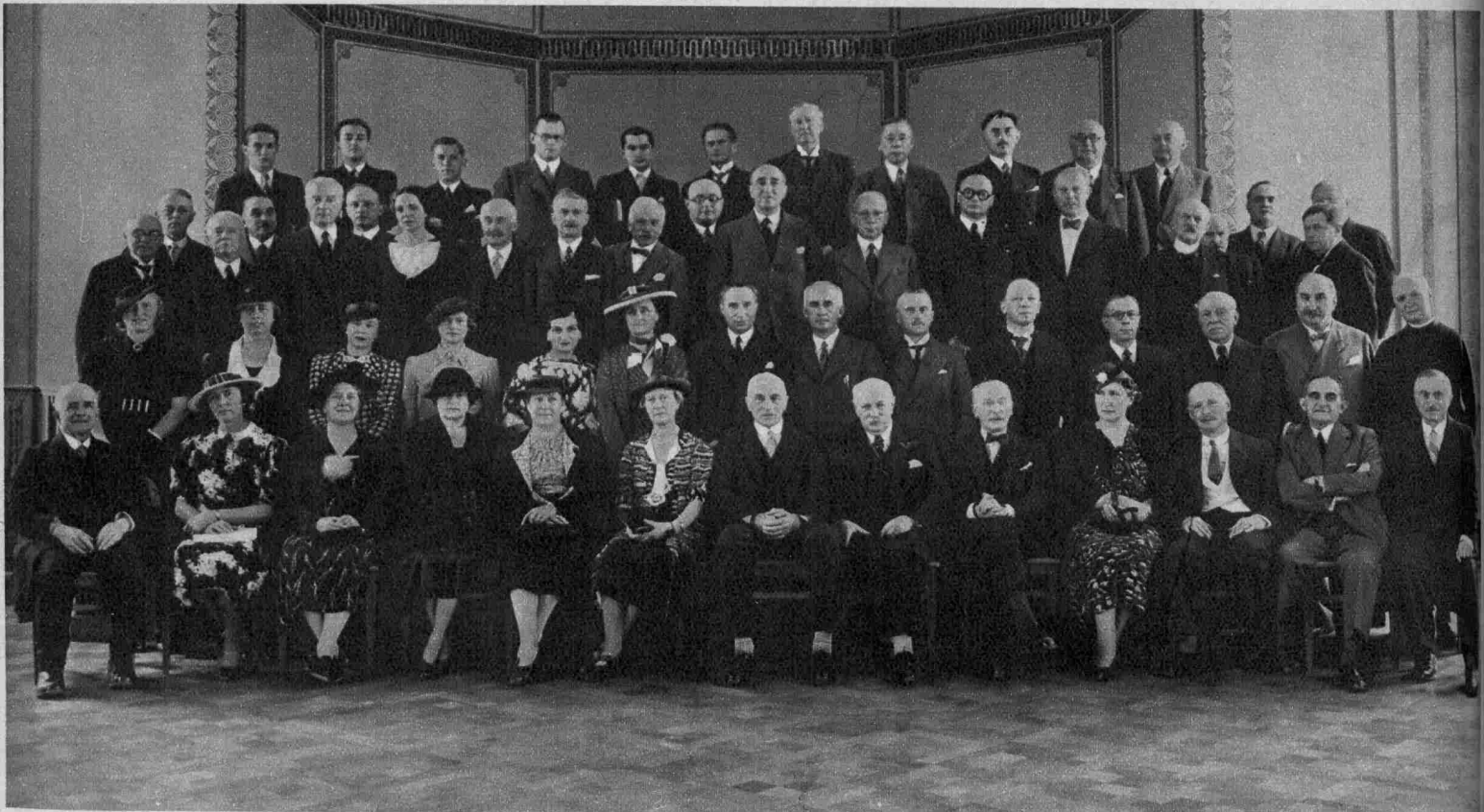
Session de l'„Institut de Droit International“, à Luxembourg du 30 août au 4 septembre 1937. Au premier rang au milieu, Sir Cecil Hurst, Président du Tribunal International à La Haye. Au même rang, le deuxième de droite à gauche, M. Politis, Ministre de Grèce.