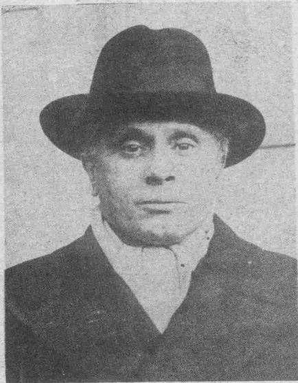
Monsieur Paul Boncour, Président de la Commission des Affaires étrangères.