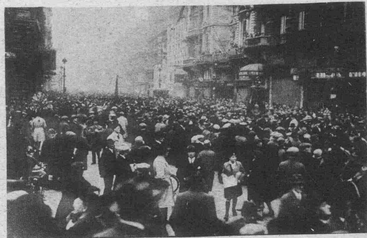
La Place de Brouckère à Bruxelles lors d'une récente manifestation. — Eine Manifestation auf dem de Brouckère-Platz in Brüssel.