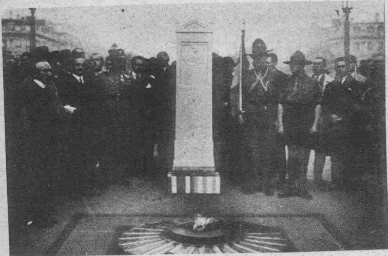
Le centenaire de la Bataille de Navarin. — Le Ministre Grec M. POLITIS a déposé une stèle en marbre sur la tombe du Soldat Inconnu. Cette stèle a trouvé entretemps son emplacement définitif au Musée de l'Armée.