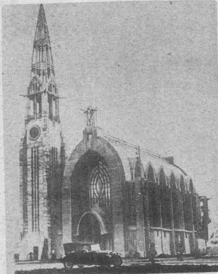
Un curieux modèle d'église vient d'être terminé à Arras. On peut remarquer le style curieux et remarquable qui a été exécuté en béton armé.