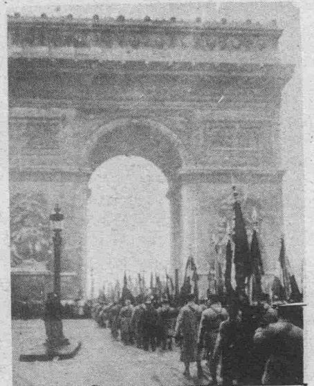
Le défilé des délégués des Etats Généraux des Mutilés de guerre à l'Arc de Triomphe devant la tombe du Soldat inconnu.