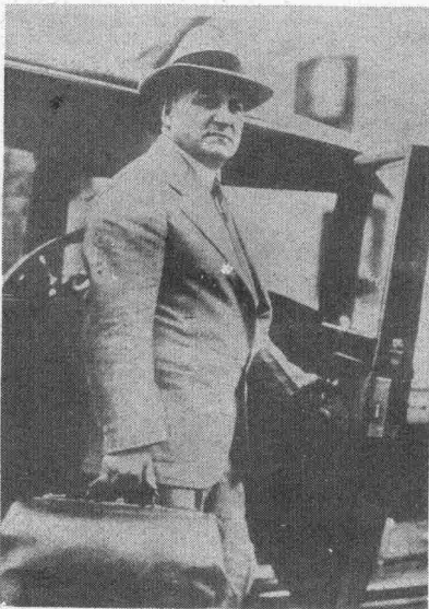
Le roi des contrebandiers de l'alcool. Georges Remus qui a gagné 5.000.000 dollars en faisant de la contrebande d'alcool en Amérique fut emprisonné pendant 2 ans. Le voilà sortant de prison. — Der Schmugglerkönig George Remus, der durch Alkoholschmuggel 5 Millionen Dollars „verdient“ hat, verlässt das Gefängnis, wo er 2 Jahre „gegessen“ hat.

Wie entsteht das Polarlicht? — In allen Reiseberichten der Polarforscher wird der wunderbaren Schönheit des Nordlichtes oder Polarlichtes gedacht, jener eigenartigen, geheimnisvollen Erscheinung, wo bänderförmige Lichtstreifen, durchglüht von prächtigen Farben, hoch am Himmel erscheinen. Um dieses wunderbare Naturschauspiel zu verstehen, ist es nötig, zuerst zu wissen, was Kathodenstrahlen sind. Diese lernen wir am besten in den sogenannten Geißler'schen Röhren kennen, Glasröhren, die mit verdünnter Luft oder einem anderen verdünnten Gase gefüllt sind. In ihrem Inneren ha-