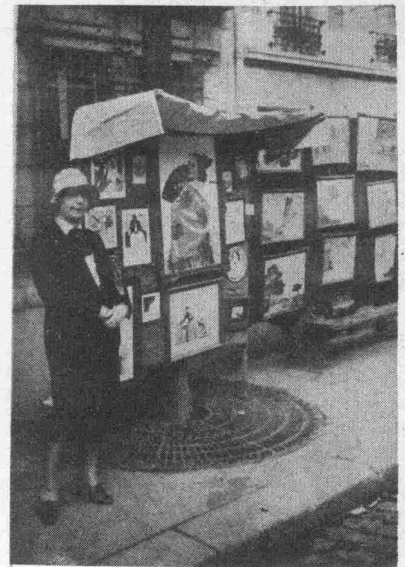
Chaque automne il y a à Paris une „Foire aux Croûtes“ en plein air. Le modèle du tableau „L'Espagnole“ vend les tableaux de l'artiste. — Die Foire aux Croûtes findet jeden Herbst in Paris auf den Boulevards statt.

„Ist es nicht erstaunlich, daß Herr Ehrhardt meinen Bitten so rasch nachgab? Ja, eigentlich brauchte ich gar nicht erst lange zu bitten. Wir plauderten ganz harmlos wie immer über allerlei, und es fügte sich förmlich von selbst, daß ich meine Ansichten über Tod und Trauer aussprechen konnte. Ich meinte, da die Seele eines Verstorbenen doch wahrscheinlich mit magischer Gewalt immer wieder dorthin gezogen würde, wo sie im Leben wandelte und sich geliebt und verstanden fühlte, sollte man ihr diese Stätten nicht verleiden durch Trauer und Verzweiflung, sondern ihr einen schlichten Tempel der Liebe bauen, der so recht ihrem eigenen Wesen angepaßt sein müsse, damit sie