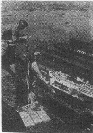
Les métiers périlleux. Ouvriers dans le vide réparant une crevasse au Building de New-York. — Schwindelfreie Arbeiter sind oben auf einem Wolkenkratzer in New-York mit Reparaturarbeiten beschäftigt.