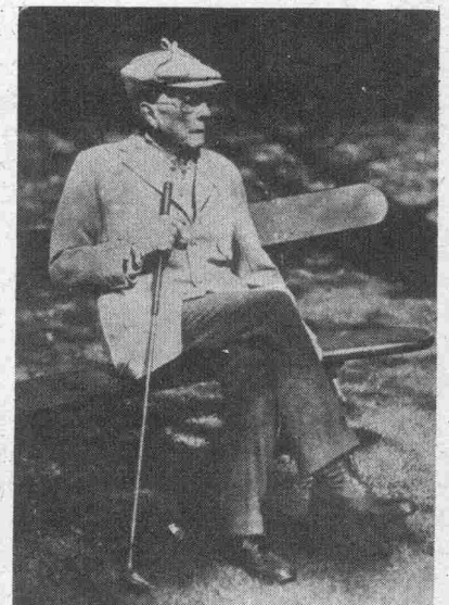
Le roi du pétrole joue au Golf. A 88 ans John Rockefeller joue au golf et est malgré son grand âge un joueur très qualifié. — Trotz seiner 88 Jahre ist der Petroleum-König John Rockefeller ein eifriger und guter Golfspieler.