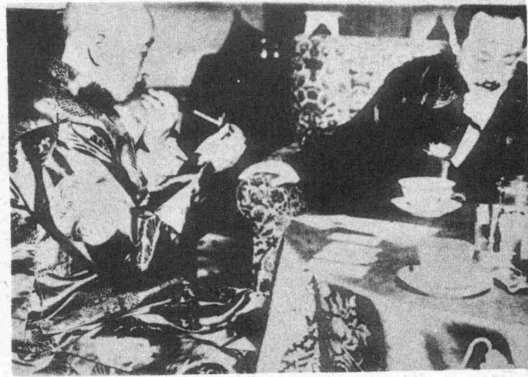
A droite: Le Maréchal TCHANG TSO LIN qui aurait été tué par la bombe lancée contre son train. — A gauche on voit le maréchal en costume national à table avec CHAO HSIM PO (à droite).

Ce sont les étudiants et les étudiantes qui essayent de semer l'agitation en Chine. — Voici une jeune fille âgée de 16 ans prononçant un discours en plein air et engageant le peuple à se dresser contre le gouvernement japonais.