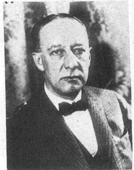
M. SMITH, gouverneur qui sera sans doute candidat démocrate.