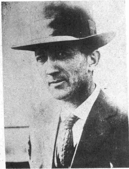
WILLIAM FOSTER qui en 1928 organisa la grève des métallurgistes sera candidat du Parti Communiste aux élections présidentielles des États Unis.