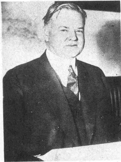
M. HOOVER désigné candidat républicain.