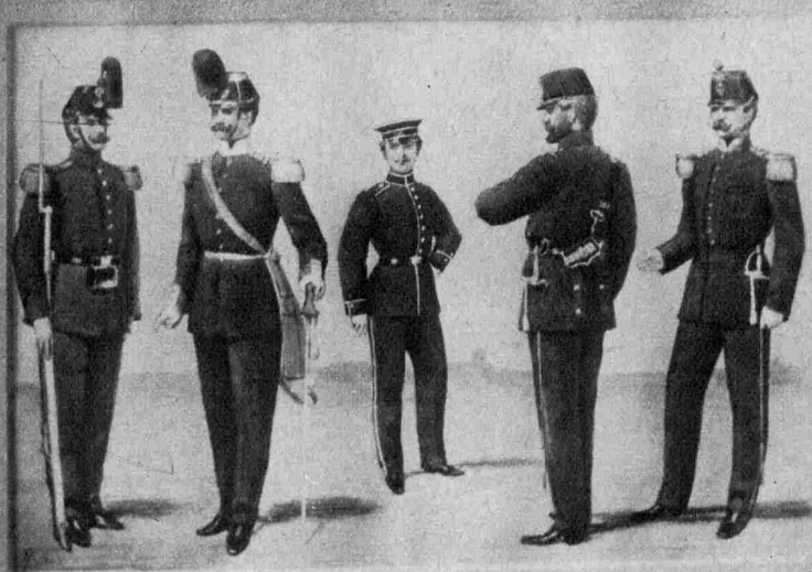
Jäger 1841-1846 Korps-Adjutant 1851-1860 Artillerist in Landwehr 1851-1860 Leutnant 1851-1860 Oberleutnant 1851-1860

man nicht behaupten, welche Vorbilder dazu dienten, ob es die Uniform der preussischen Armee, ob es die der österreichischen, oder die des französischen