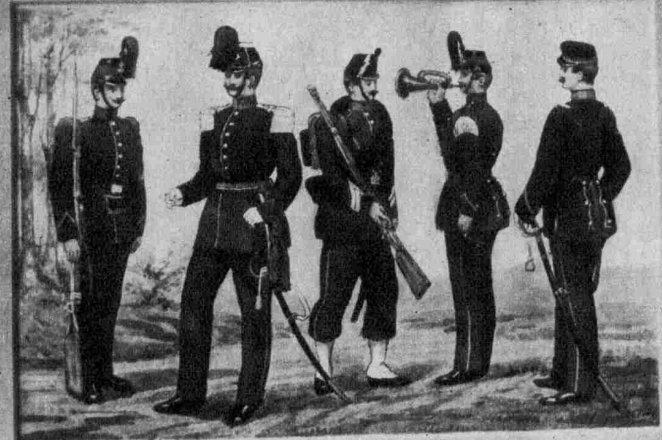
Jäger 1859 Oberleutnant in Landwehr 1851-1859 Scharführer 1859 Hornist 1859 Offizier in Landwehr 1851-1863