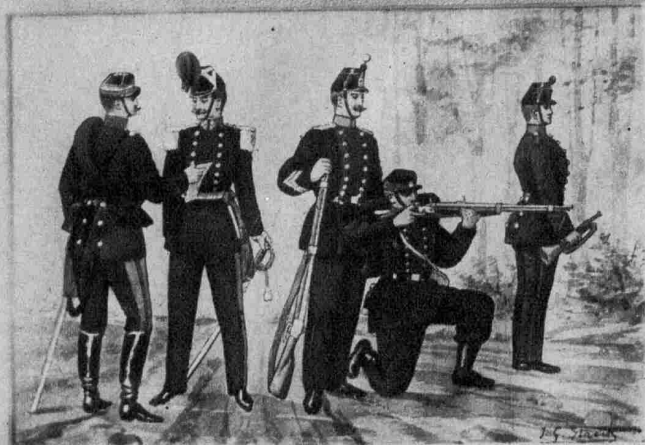
Offizier in Landwehr Offizier in Landwehr Majoral in Landwehr Freiwilliger Hornist