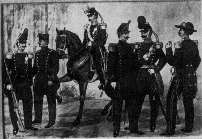
Infanterist 1841-1846 Artillerist Jäger zu Pferd Habsart Leutnant Schützenführer