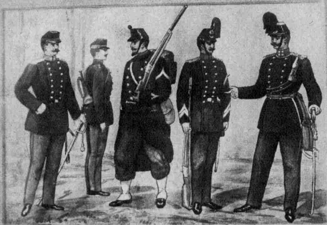
Leutnant in Landwehr Hornist Sergeant in Landwehr Majoral in Landwehr Oberleutnant in Landwehr