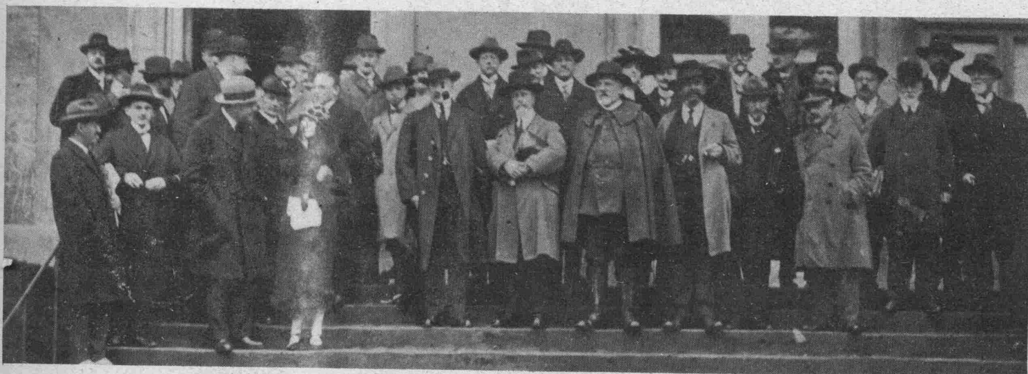
Le Congrès International pour l'Etude et la Protection des Oiseaux, organisé par les Ligues belge, française et luxembourgeoise pour la Protection des Oiseaux, a eu lieu à Luxembourg du 13 au 16 avril.

Diejenigen Leser, die sich nachträglich an der Serie beteiligen wollen, und welche die erschienenen Nummern nicht mehr bei ihrem Zeitungshändler vorrätig finden, mögen sie schriftlich beim Verlag verlangen, unter Beifügung von 50 Centimes pro Nummer.