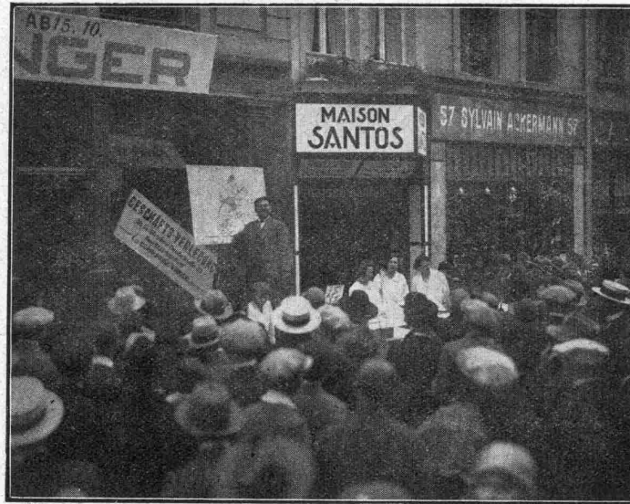
N° 563

— Zweite Braderie in Luxemburg (Fortsetzung)