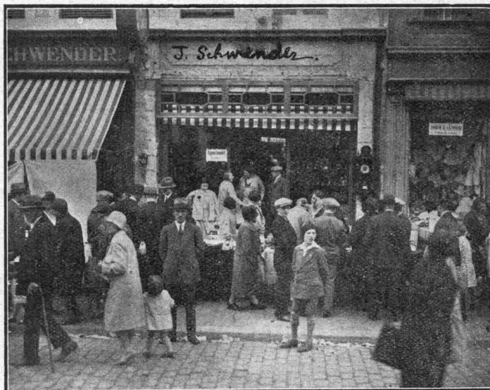
N° 559