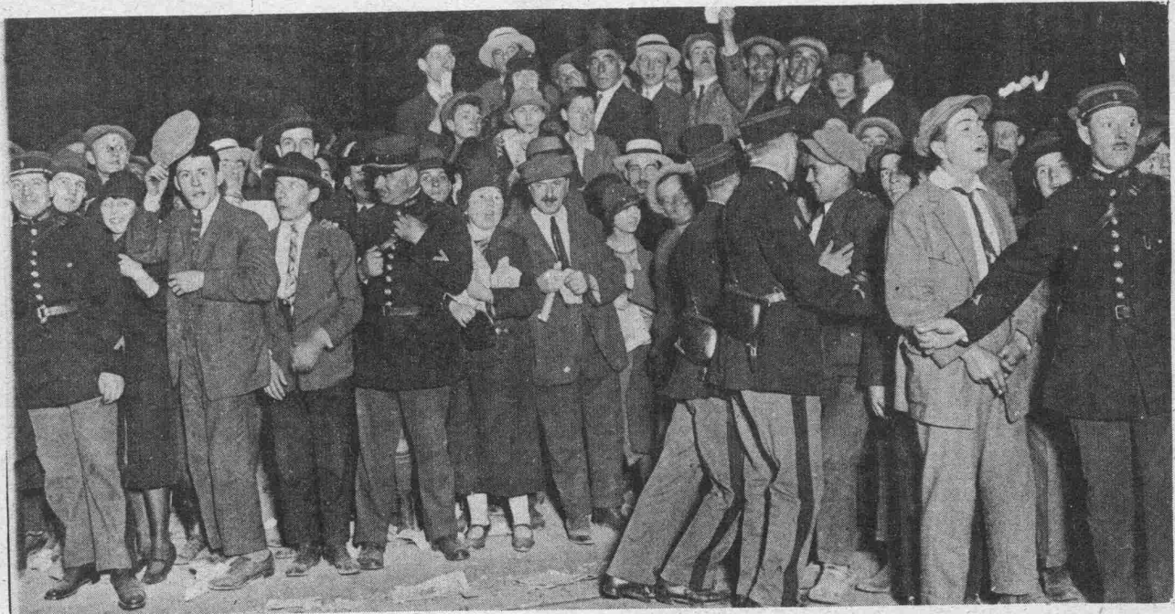
Une foule enthousiaste assiste au départ du Tour de France.