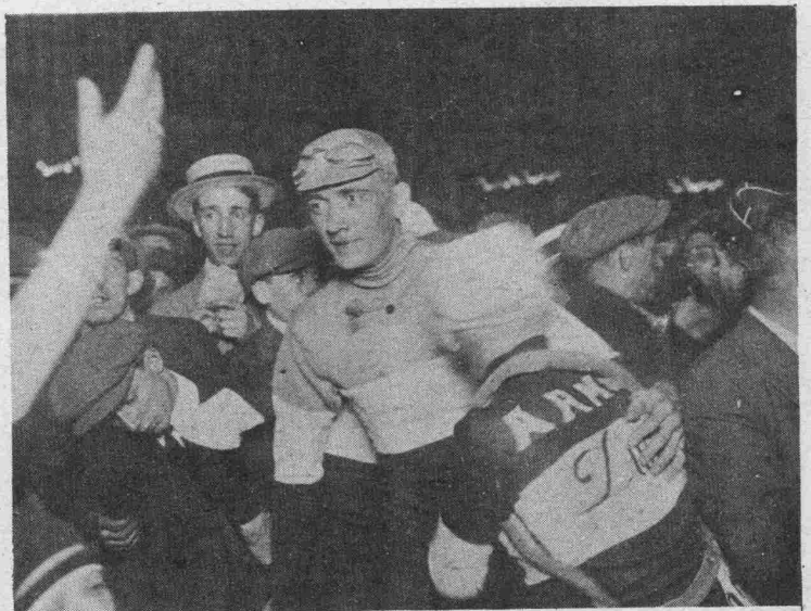
Francis Pélissier acclamé par la foule.