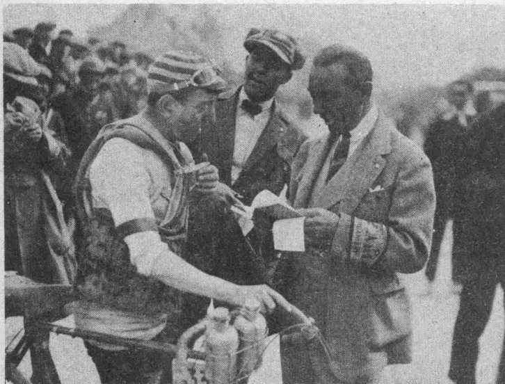
Une „arrivée“ foudroyante de Biscot.