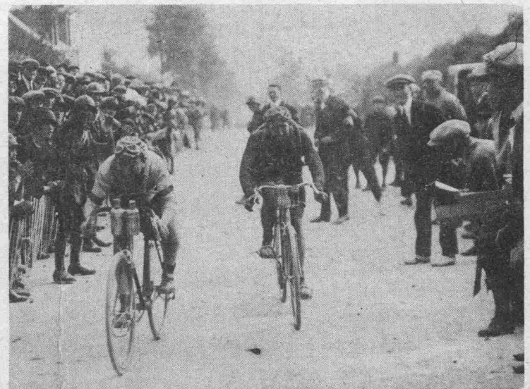
BISCOT , le désopilant artiste de cinéma, tournant un film: Le Roi de la Pédale, arrive au contrôle de Cherbourg.