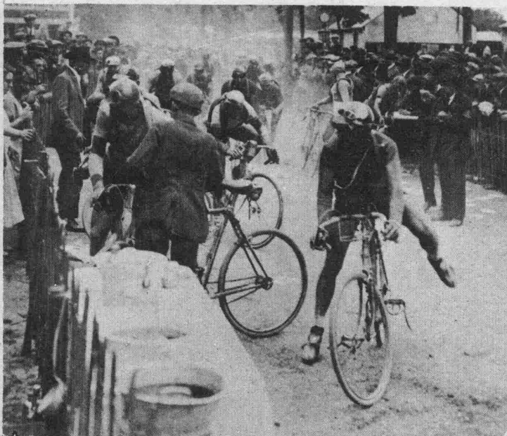
Etape Vannes - Les Sables: Le ravitaillement de Nantes