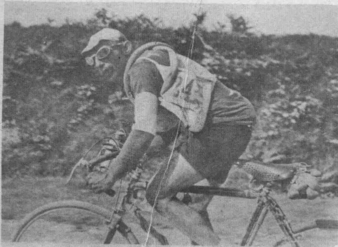
Adelin Benoit, le vainqueur de la 8. étape du Tour de France