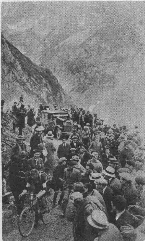
BENOIT au Tourmalet.