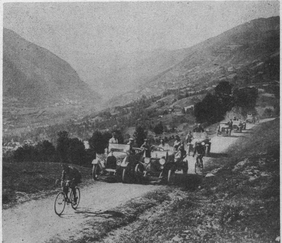
La Montée de Mont-Louis