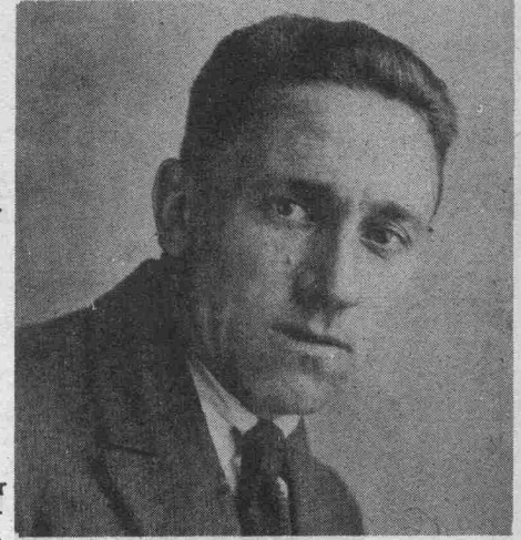
THYS, a abandonné au cours de la 9 e étape.