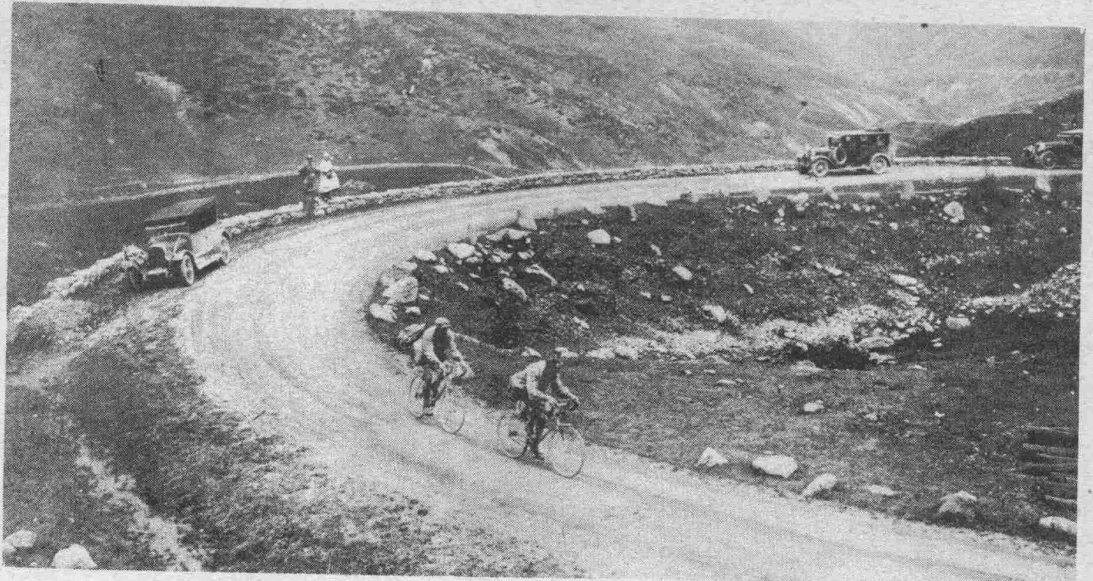
FRANTZ et DEJONGHE se sauvent dans Puymorens.

Bedingungen und Preise, siehe „Tour de France Illustré“ Nr. 1.