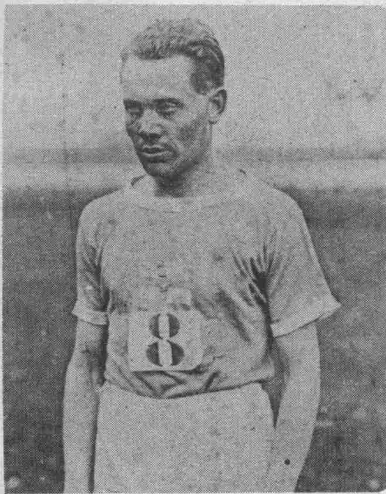
Sport-Preisrätsel Nr 8.

Bedingungen und Preise, siehe „Tour de France Illustré“ Nr. 1.