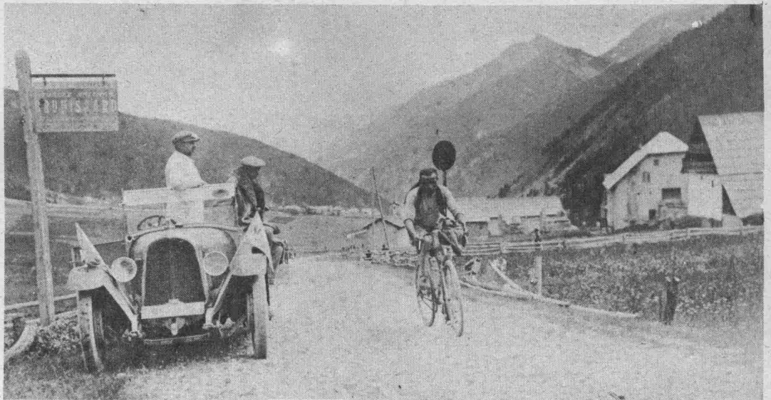
Aymo, le vainqueur de l'étape Nice-Briançon du Tour de France.

Bedingungen und Preise, siehe „Tour de France Illustré“ Nr. 1.