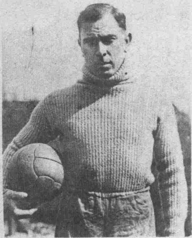
Sport-Preisrätsel Nr. 9.

Bedingungen und Preise, siehe „Tour de France Illustré“ Nr. 1