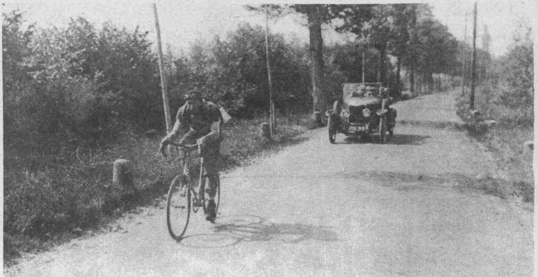
Etape Briançon - Evian. Après une crevaison, Frantz poursuit le peloton de tête.

Bedingungen und Preise, siehe „Tour de France Illustré“ Nr. 1