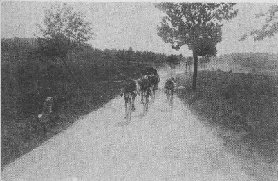
FRANTZ emmène le peloton après Montbéliard