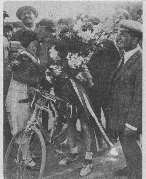
BOTTECCHIA, à son arrivée à Mulhouse, embrasse une de ses compatriotes qui lui a offert un bouquet.