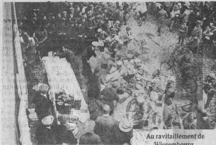
Au ravitaillement de Wissembourg.

Das nebenstehende Sport-Preisrätsel Nr. 10 ist das letzte der Serie. Die richtigen Lösungen müssen mit allen dazu gehörigen Coupons bis spätestens 1. August an den Verlag der „Luxemburger Illustrierten“ in Luxemburg, Postfach 114, eingesandt werden. Es genügt, die Namen der einzelnen 10 abgebildeten Sportleute in der richtigen Reihenfolge auf ein Blatt Papier zu schreiben und nebst den 10 entsprechenden Coupons einzusenden. Das Einsenden der betr. Porträts ist somit überflüssig. Die Namen der Gewinner werden in einer der ersten Augustnummern veröffentlicht werden.