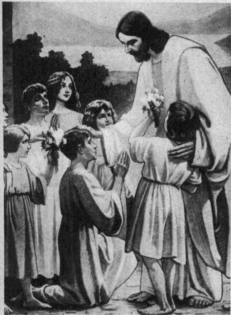
JESUS DER KINDERFREUND (Rümelingen)

Damit schieden wir von dem Meister, der wohl als der größte Kirchenmaler unseres engeren Heimatlandes angesprochen werden kann. In unermüdlicher, rastloser Arbeit hat er während nahezu 20 Jahren in Kirchen im Oesling und Gutland sein Gesamtwerk geschaffen.